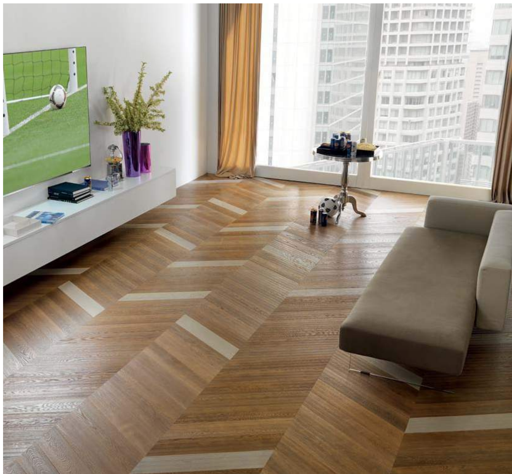
ROVERE BERTI STUDIO - ON DEMAND OAK BERTI STUDIO - ON DEMAND